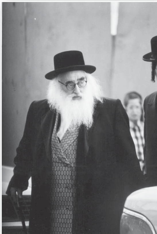
כ"ק מרן אדמו"ר מויז'ניץ-מונסי