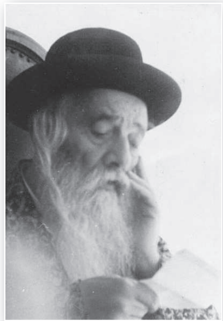
כ"ק מרן אדמו"ר היאמרי חיים' מויז'ניץ