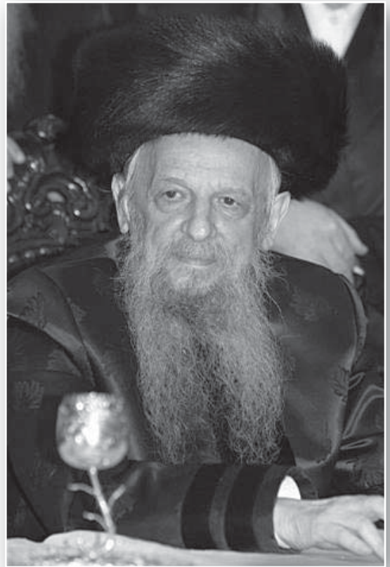
כ"ק מרן אדמו"ר מסערט ויז'ניץ

וכמים הפנים לפנים כן לב האדם לאדם, הרבי החזיר לו אהבה והערכה עד למאוד. וכשנכנסו אל הקודש פנימה הביע הרבי בפנינו את התפעלותו ממידת החסד הגדולה שהייתה באבינו.