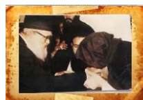
Rav Yaakov Kamenetsky with the Baba Sali Zatzel

Le Netsiv 4 délimite les distinctions entre le Bavli et le Yerouchalmi . Il assimile ce-dernier aux 1 ères Lou'hot , qui nous ont été donnés avant que nous ne péchions avec le Eguel . La sainteté des 1 ères Tables était plus grande que celle